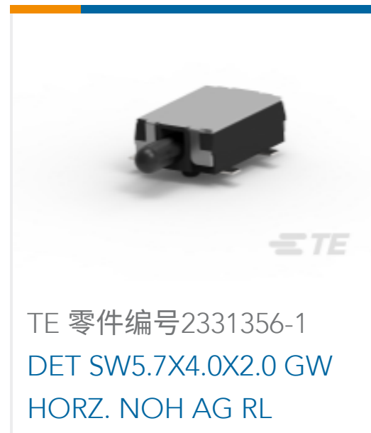
TE 零件编号2331356-1 DET SW5.7X4.0X2.0 GW HORZ. NOH AG RL