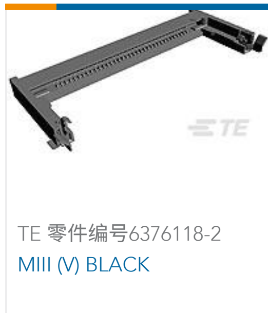
TE 零件编号6376118-2 MIII (V) BLACK