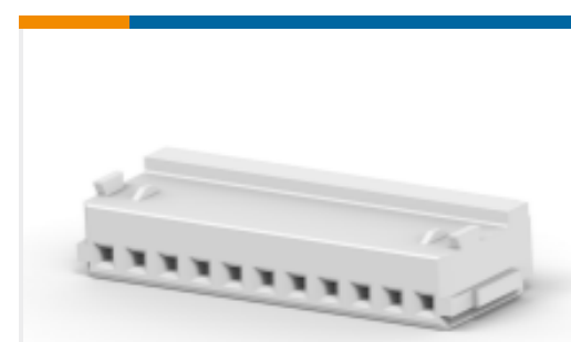
TE 零件编号 1-353908-1 CT REC HSG 11P CRIMP TYPE WHIT