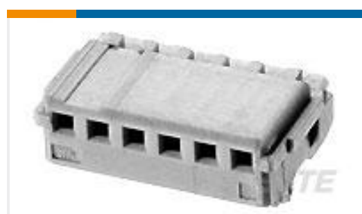
TE 零件编号 7-353908-1 CT REC HSG 11P CRIMP TYPE BLU