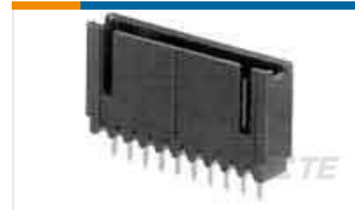
TE 零件编号5-103414-9 11 MODII HDR SRST SHRD LF