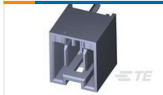
TE 零件编号2232043-2 2P, RAST 5 Tab Header, THV