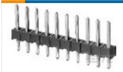
TE 零件编号6-146293-2 12 MODII HDR SRST B/A 100 W/HD