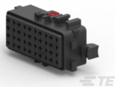
TE 零件编号 1587335-1 BASE ASSEMBLY, 40 POSITION