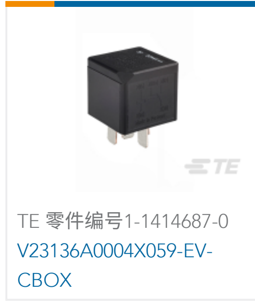
TE 零件编号1-1414687-0 V23136A0004X059-EV- CBOX