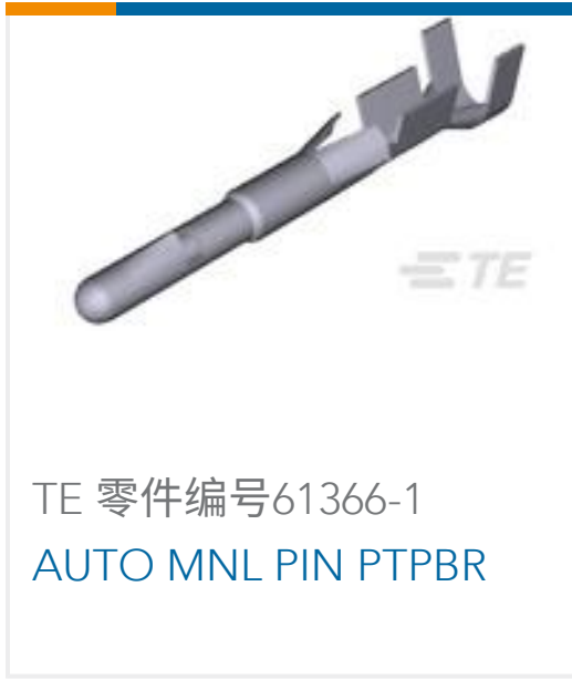
TE 零件编号61366-1 AUTO MNL PIN PTPBR