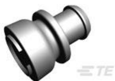
TE 零件编号 828922-1 2,5MM CAVITY PLUG FOR 5,4MM DI