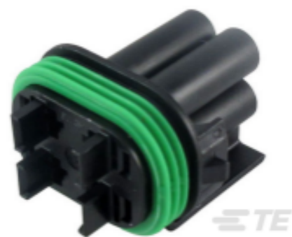
TE 零件编号 2066046-1 2 POS MINI FUSE BOX ASSY