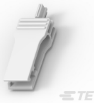
TE 零件编号 1443998-1 FUSE PULLER