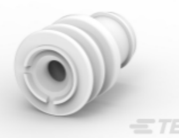
TE 零件编号 828905-1 SINGLE-WIRE-SEAL(5MM HOLE)