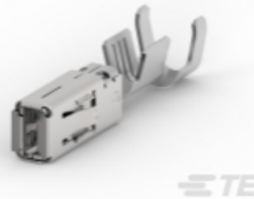
TE 零件编号 1-968857-1 AMP MCP 2.8, CONTACT SWS