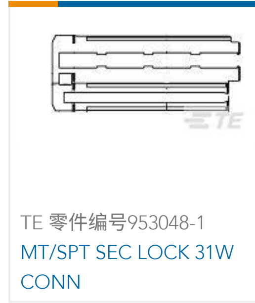
TE 零件编号953048-1 MT/SPT SEC LOCK 31W CONN