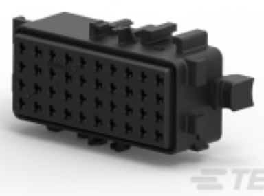
TE 零件编号 109853-1 BASE, 40 POSITION