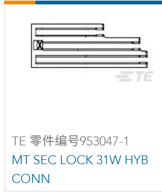
TE 零件编号953047-1 MT SEC LOCK 31W HYB CONN