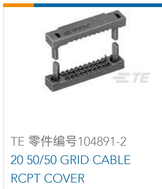
TE 零件编号104891-2 20 50/50 GRID CABLE RCPT COVER