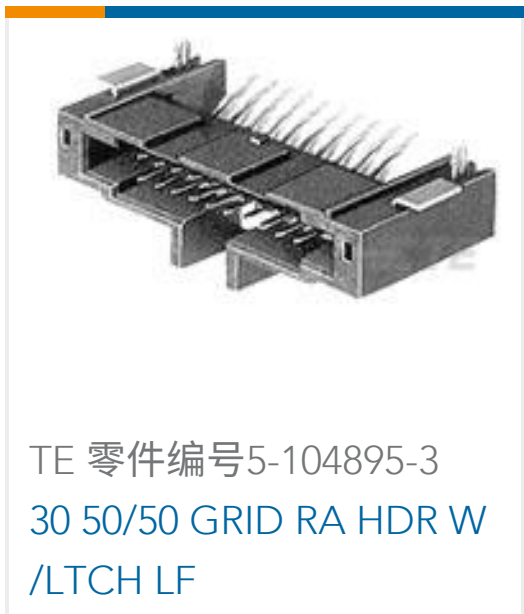
TE 零件编号5-104895-3 30 50/50 GRID RA HDR W /LTCH LF