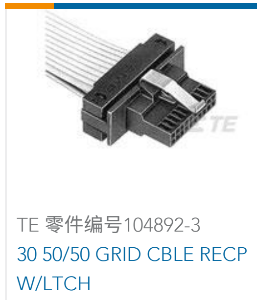
TE 零件编号104892-3 30 50/50 GRID CBLE RECP W/LTCH