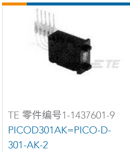
TE 零件编号1-1437601-9 PICOD301AK=PICO-D- 301-AK-2