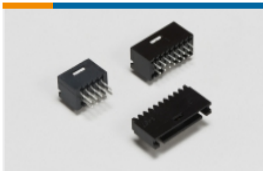
多配置 PCB 接头和插座(13)