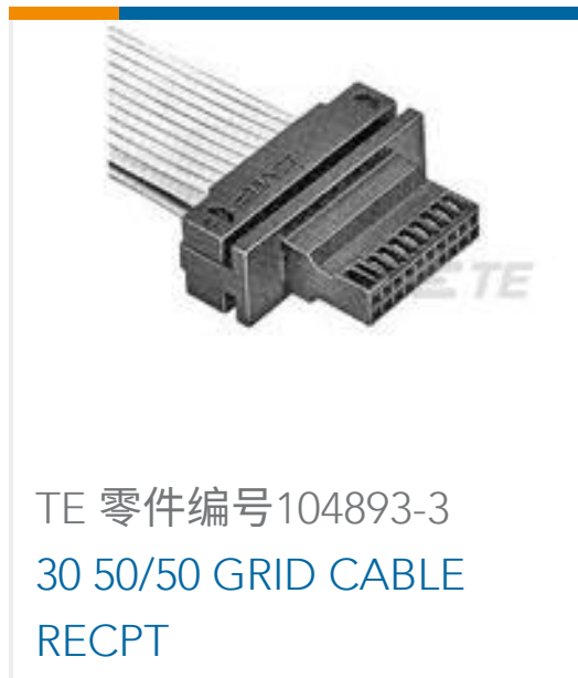
TE 零件编号104893-3 30 50/50 GRID CABLE RECPT