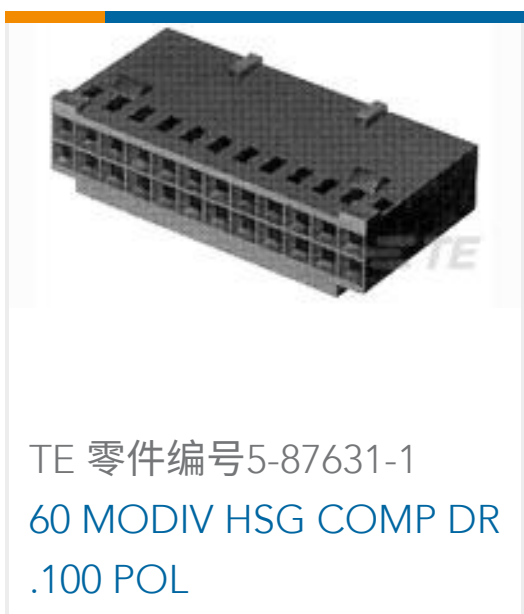
TE 零件编号5-87631-1 60 MODIV HSG COMP DR .100 POL