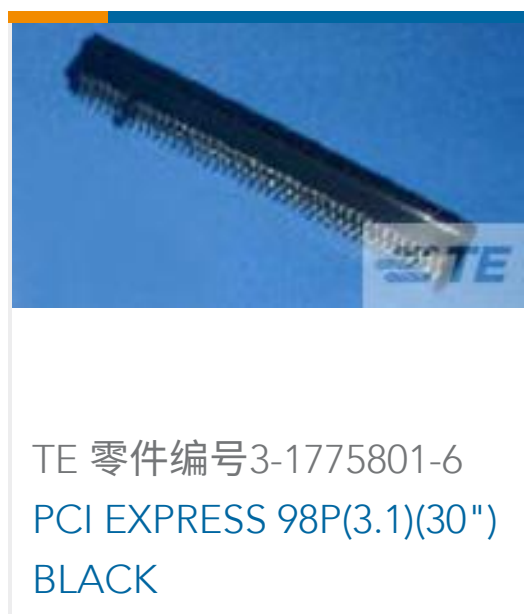
TE 零件编号3-1775801-6 PCI EXPRESS 98P(3.1)(30") BLACK