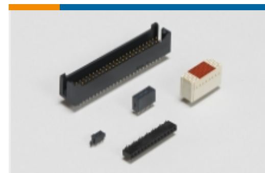
板对板接头和插座(41)