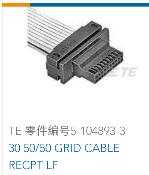
TE 零件编号5-104893-3 30 50/50 GRID CABLE RECPT LF