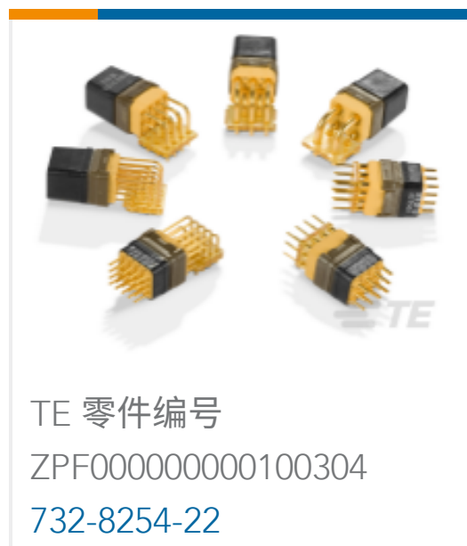
TE 零件编号 ZPF000000000100304 732-8254-22