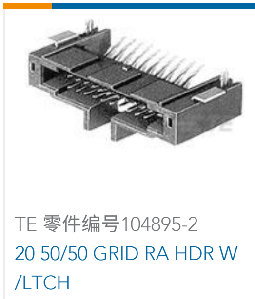
TE 零件编号104895-2 20 50/50 GRID RA HDR W /LTCH